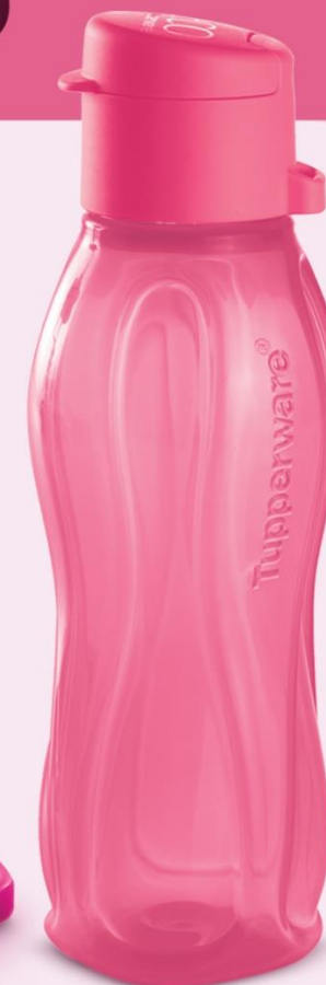
Set Valorado en Q103